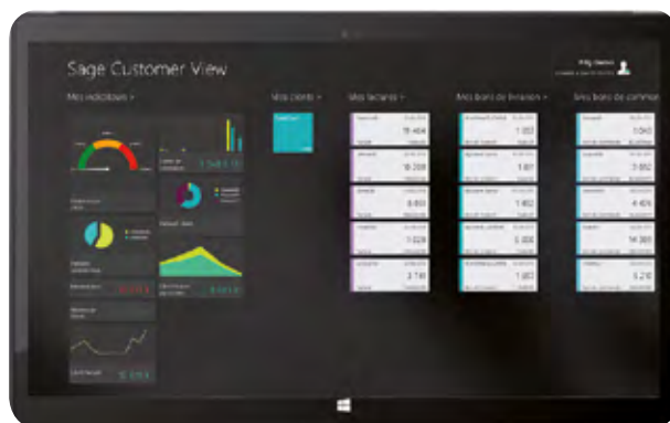
Sage Customer View : tableaux de bord des indicateurs clés